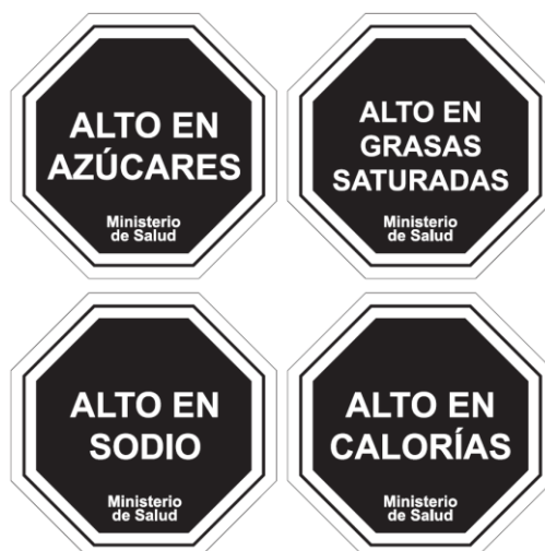
Diagrama N° 1

Las características gráficas de los descriptores nutricionales señalados en el Diagrama N°1 serán las siguientes: